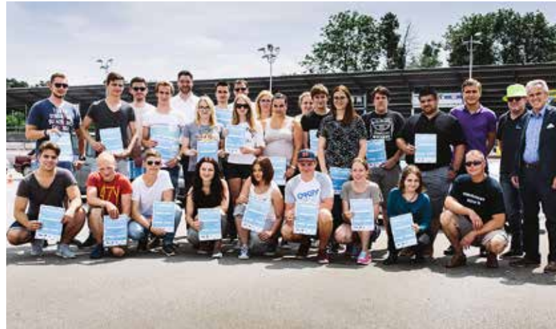
"Könner durch Erfahrung 2016"